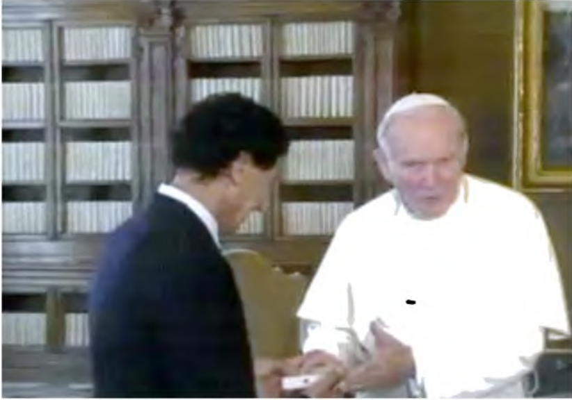
من لقاء بين عبد السلام جلود والبابا يوحنا بوليس الثاني، الفاتيكان، 1988 / 11 / 27.